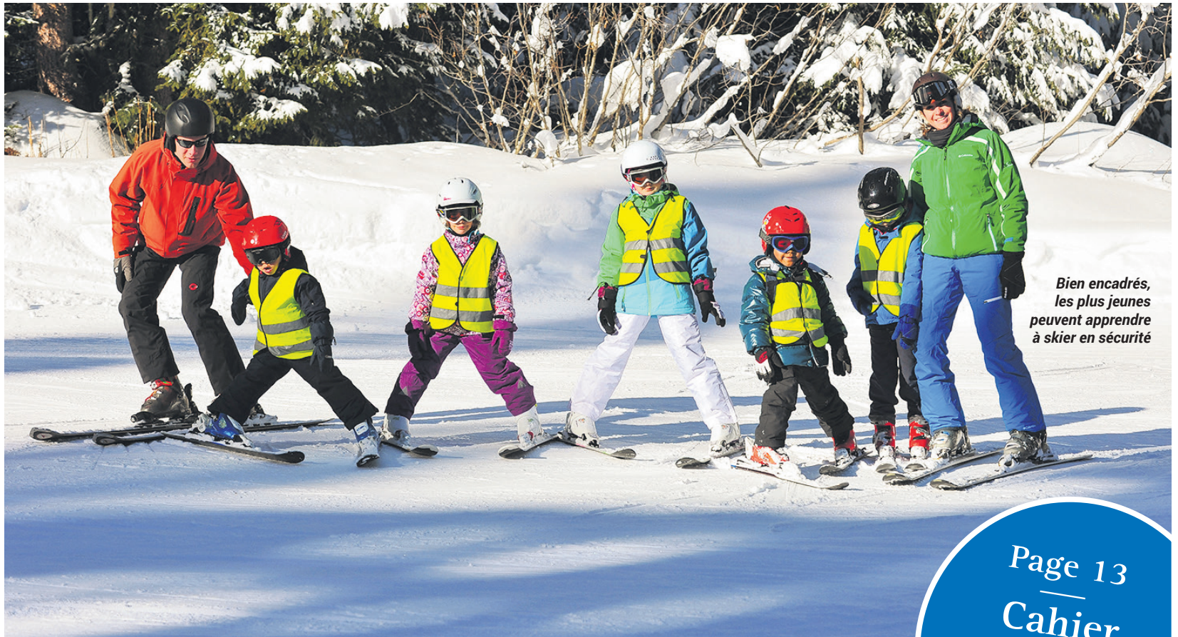
Bien encadrés, les plus jeunes peuvent apprendre à skier en sécurité